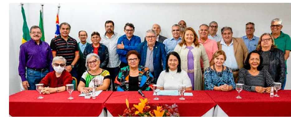
Representantes das associações.

Foi realizada também a votação do local onde acontecerá o próximo ENAC-Encontro Nacional dos Aposentados, no período de 01 a 05 de dezembro/2022, sendo escolhida a cidade de Belo Horizonte-MG, quando haverá a eleição do novo presidente e demais membros da diretoria da FAACO, para o triênio 2022/2025.